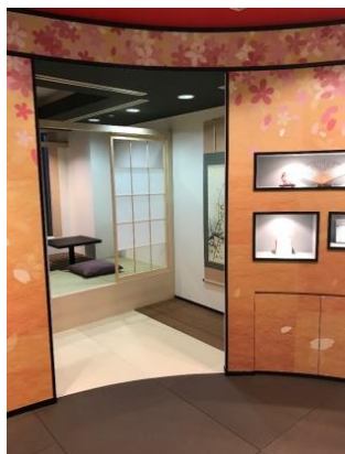
日本を感じさせる内装（イメージ）

ホテルスパ事業を行なう株式会社クレドインターナショナル（本社：東京都中央区、代表取締役社長：白井浩一）は、日本人セラピストが施術するアジアンリラクゼーションサロン『 サナティオ スパ SANATIO SPA』を、カナダのブリティッシュコロンビア州バンクーバーのアパホテル系列の「COAST coal harbour hotel by APA」内に、2018 年 5 月 25 日オープンします。施術者全員が日本人のホテルスパは、バンクーバー初です。