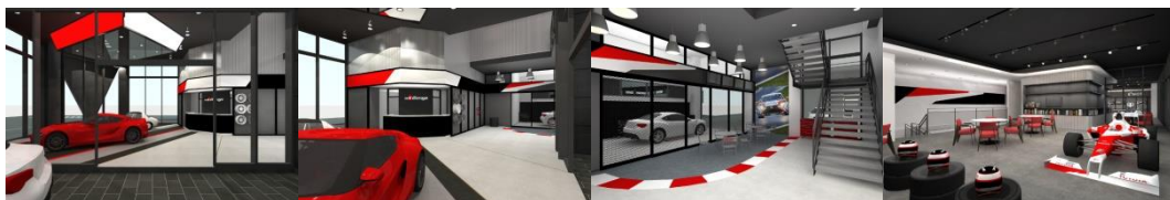
(GR ガレージ豊田元町イメージ図)

(2)トヨタローラ中京のエンジニアによる全日本F3選手権全 19 戦をフルサポート 人材育成の一環として毎戦 2 名のエンジニアを派遣し、緊張感ある本格レースを経験することで「クルマを感じるセンサー」を磨いてまいります。