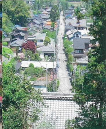
岩殿観音からの眺望