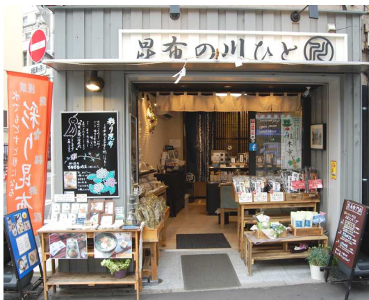
昆布の川ひと浅草店

■URL： http://www.office-web.jp/kawahito/