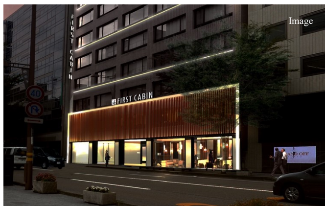
元金融機関であった重厚感のある建物を有効活用