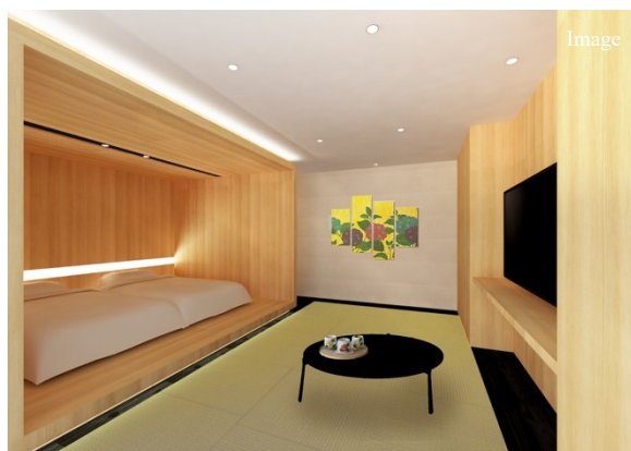
ツインのローベッドを備えたプレミアムクラス

併設された直営の飲食施設「Café & Bar 15」では暖炉やグランドピアノを備えた重厚感のある空間で朝食から夜のバーまでお楽しみいただけます。宿泊利用者だけでなく、近隣のビジネスマンや地元の方など、どなたでも気軽にご利用いただける、地域に根ざした施設を目指します。