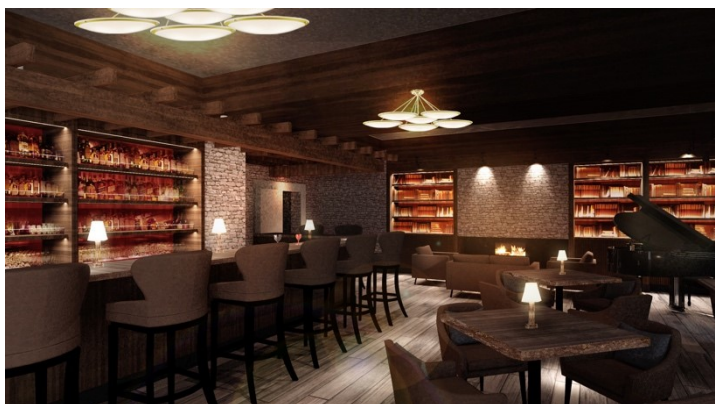
併設の「Café & Bar 15」は暖炉のある落ち着いた空間