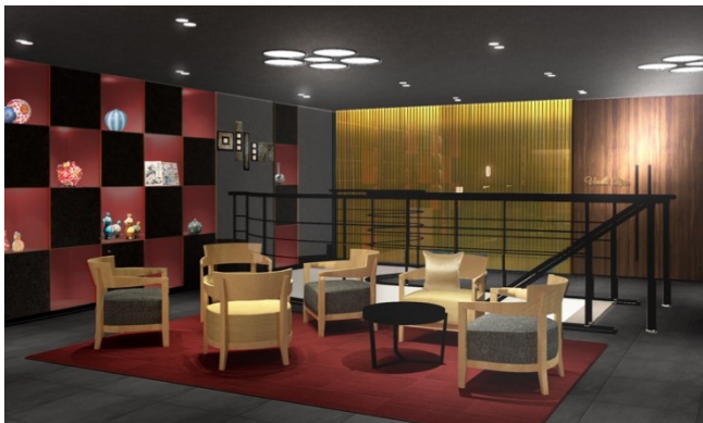
金沢らしさを演出したロビー