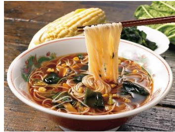
<ローカロ麺定番シリーズ>