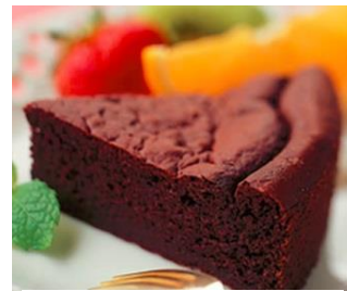
<豆乳ガトーショコラ>