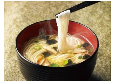
<ローカロにゅうめん>