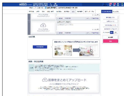
入稿画面イメージ