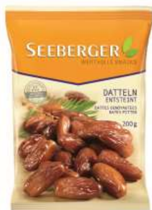
出荷数がシリーズトップの 『ドライフルーツ デーツ』