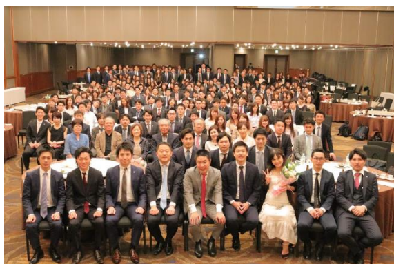
『第 15 期 DYM グランドアワード』集合写真

WEB 事業や人材事業、海外医療事業を行う株式会社 DYM（読み：ディーワイエム、本社：東京都品川区、代表取締役社長：水谷佑毅）は、社員を表彰する式典『グランドアワード』を、2018 年 5 月 19 日に開催しました。社員の家族も招待する盛大なイベントで、今年は 276 名が参加し、90 名の各種表彰や 28 名の昇格発表を行いました。また、当社内公認 11 組目となる新カップルが全員の前で交際宣言をしたため、当社独自の社内制度「社内カップル手当」が適用され、3 万円が支給されました。