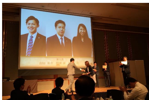
年齢も職種も関係なく、正當に評価される社風