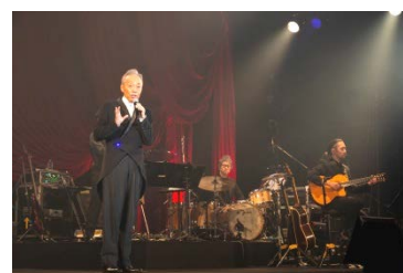
谷村新司さんのプレミアムステージ