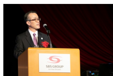
三毛三菱UFJ銀行頭取による来賓のご挨拶