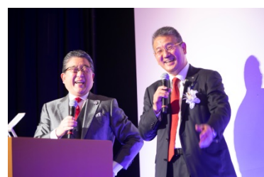
司会の徳光和夫さんとエンディングトーク