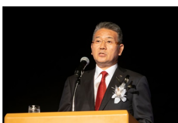
鎌田社長による主催者挨拶