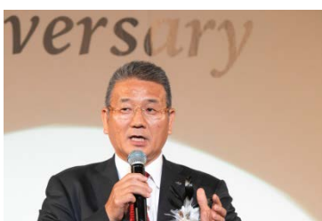
感謝を込めて閉会の挨拶