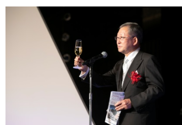
SGHD栗和田会長による乾杯のご発声