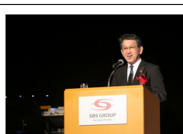
山下リコー社長による来賓のご挨拶