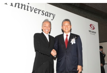
谷村新司さんとガッチリと握手