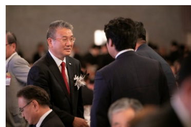
多くの方々からお祝いの言葉を頂戴