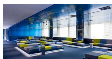
フクラシア丸の内オアゾ