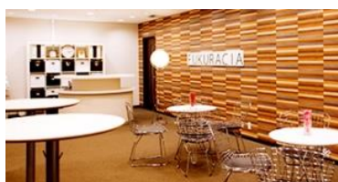
フクラシア品川（高輪）