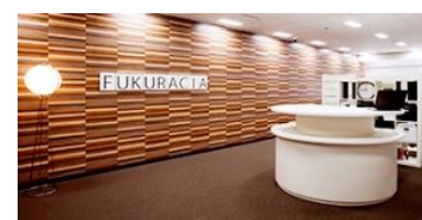
フクラシア浜松町