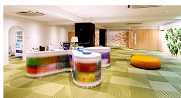
フクラシア八重洲