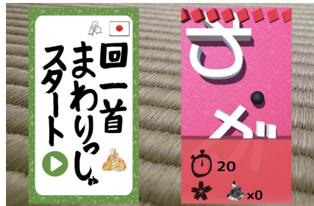
作品名：回一首（まわりっしゅ）