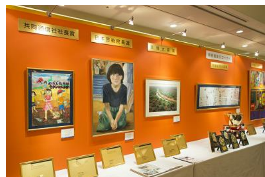
■ 第 61 回特別賞展示(表彰式会場)