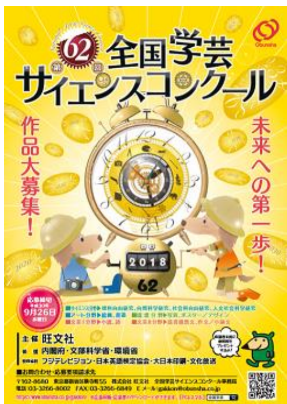
■ 第 62 回全国学芸サイエンスコンクールポスター

1957 年(昭和 32 年)より毎年開催してきた学コンは、60 回を超えるコンクールとなりました。今年は「未来への第一歩！」をテーマに掲げ、学コンを通して子どもたちの「考える力」「生きる力」を養い、豊かな人間性や感性を育んでいただきたいと考えております。