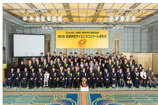
■ 第 61 回表彰式(ホテルオークラ東京にて)