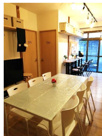
シェアハウスのリビング

新プログラムでは、TCC 岡山スクールで東京行きの条件をクリアした後、上京して就職先が決まるまで家賃負担なしで住めるシェアハウスの住居を用意しています。そして、TCC 東京スクールでさらに研修を受けながら、紹介された企業の面接を受けて東京での就職先を探していただきます。就職が決まった後もシェアハウスに住む場合は、入社月から家賃が発生しますが、就職するまでは入居費、インターネット通信費、光熱費、さらにはシェアハウス内に設置されたウォーターサーバーの水やお米もすべて無料です。