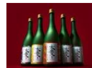
純米大吟醸・本菱