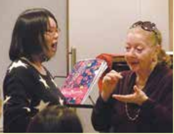
過去の講習会より

公開グループコースの講習は公開制です。聴講券をご購入いただければどなたでも聴講可能です。聴講日の予約はできません。レッスン室は50名近く聴講いただけますが、満席のためにお断りする場合がありますので、あらかじめご了承ください。 前売り聴講券 をお持ちの方を優先的に入場させていただきます。レッスン途中の入退室は可能です。