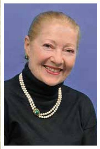
過去の講習会より

イタリア・ヴァレーゼ在住の名ソプラノ歌手。弱冠16歳でオペラ主役デビュー。 イタリアオペラの殿堂ミラノ・スカラ座で初めての出演以降、20年間途切れる事なくスカラ座において全シーズン、全てのスカラ座世界ツアーに出演。 1969年にはスカラ座より「金の胡桃賞」を授与された他、イタリア国内外の主要歌劇場で高い評価を受けた。 1967年第5次NHKイタリア歌劇団日本公演ヴェルディ作曲「仮面舞踏会」のオスカル役、プッチーニ作曲「ラ・ボエーム」のムゼッタ役で初来日。 1981年ミラノ・スカラ座初来日公演でも再度ムゼッタ役で来日している。 正統的なベルカント唱法の歌い手として名声を博し、現役を退いた今日ではベルカント唱法の希少な指導者として活躍している。