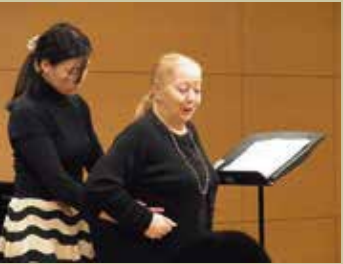
過去の講習会より

受講回数に制限はありません。一度きりのレッスンで学ぶことはなかなか難しいので、できるだけ複数回の受講をお薦めしております。 レッスンはできる限りご希望のコマをお取りしますが、先着順によりご希望に添えない場合がありますので、あらかじめご了承ください。