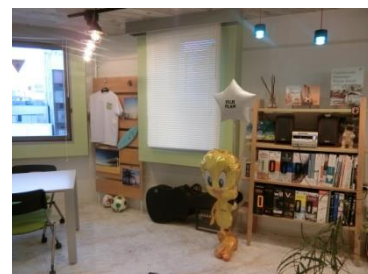
海やサッカーをモチーフにレイアウト

社員からは、「内装が変わり気分一新」「省スペースでも居心地の良さと使いやすさがある」「仕事をはかどる環境づくりを今後も研究したい」「季節によって内装を変えたい」「お客様に提案できそうなアイデアを発見」など好意的な意見を述べています。