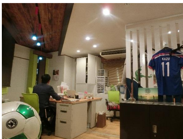
<以前>3階 賃貸管理部専用オフィス『海とサッカー』

当社のオフィス作りでは、『社員が通いたくなる部屋』をコンセプトに、テーマを決めて扉を開けた時に人に感動を与える部屋づくりをおこなっています。また、社員が主体となってオフィス作りに取り組むことで、顧客が持つ物件売却でのリフォーム提案のアイデアやヒントに役立てています。