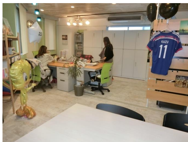
<現在>5階 賃貸管理部専用オフィス『海とサッカー』