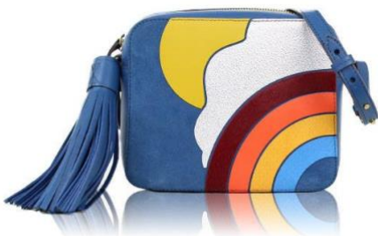
★LOUIS VUITTON★ ウィルシャーPM

持ち手のバンブー素材がとっても軽やか♡ 洋服にはもちろん和の装いにも合うので浴衣で お出かけも素敵ですね♪