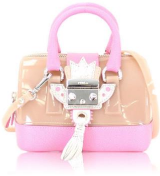
★FURLA★ Candy Bag

日本最大のバッグシェアリング・サービス「ラクサス」は、季節に合わせたバッグの使い分けでオシャレを楽しんでもらえるように多種多様なブランドバッグをご用意しています。今回は、これから迎える夏に清涼感と軽やかな印象を与える、様々な素材のバッグをご紹介します。