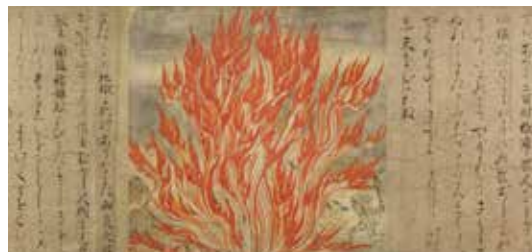
上:東洲斎写楽《市川蝦蔵の竹村定之進》江戸時代 寛政6(1794)年 重要文化財 下:《地獄草紙》平安時代(12世紀) 国宝

東京国立博物館の所蔵品の中より、 縄文時代から江戸時代まで、各時代 の名品を一堂に紹介します。縄文土 器や埴輪から、江戸時代の若冲や北 斎まで、日本美術の流れを、国宝や 国指定の重要文化財などをまじえた 貴重な作品でとどります。日本の芸 術、文化に通底する特質や、美意識 をふり返るとともに、本展がこれか らの文化継承とさらなる発展につい て考える契機となることを願い、開 催いたします。