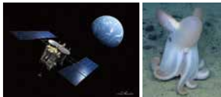
左:小惑星探査機「はやぶさ2」旅立ち イラスト:池下 章裕 右:深海の生物 ジュウモンジダコ

国立研究開発法人宇宙航空研究開発機構 (以下、JAXA)と国立研究開発法人海洋研究 開発機構(以下、JAMSTEC)の全面的な 協力のもと、「未知への挑戦～夢を追う人々 ～」をテーマとして、実際のロケットエンジン をはじめ、ロケットや調査船の大型模型や小 惑星や深海の映像により、生活圏の拡大、深 海へ宇宙へ、そして、生命の起源、深海か宇 宙かという研究成果を紹介。最先端の科学 技術への関心や未知への探究に思いを馳 せる契機となることを願い、開催いたします。