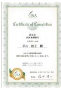
一般社団法人 日本アロマセラピー学会 認定医師