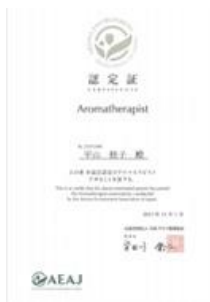
公益社団法人 日本アロマ環境協会 認定アロマセラピスト