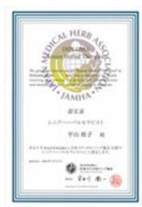
特定非営利活動法人 日本メディカルハーブ協会 シニアハーバリセラピスト