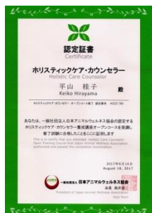
一般社団法人 日本アニマルウェルネス協会 ホリスティックケア・カウンセラー