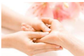
おしゃべりアロマハンドトリートメント