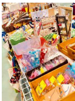
ハンドメイド雑貨