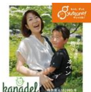
数々のメディアで話題の 多機能抱っこひも