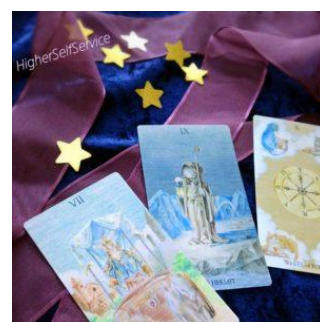
ねこタロット占い