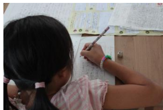
夏休みの勉強部屋