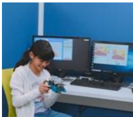
きっずプログラミング体験 「ロボットを操縦してみよう！」