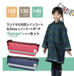
レインコート、 レインコートポーチ 「KAPAP」の販売