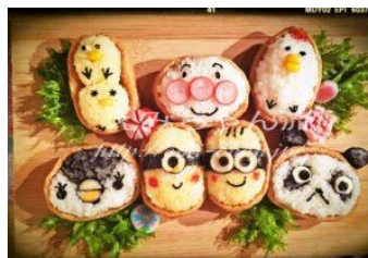
デコいなりをつくろう