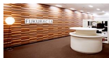
フクラシア浜松町