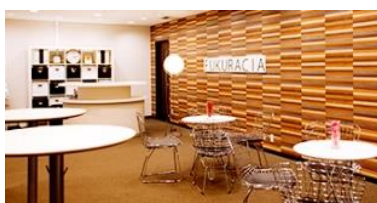
フクラシア品川 (高輪)