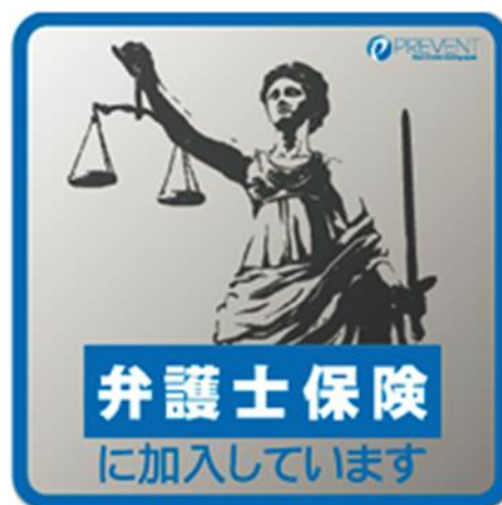
リーガルステッカー