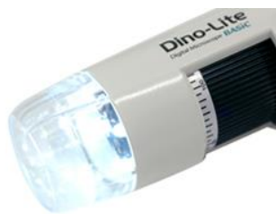
マイクロスコープ「Dino-Lite」