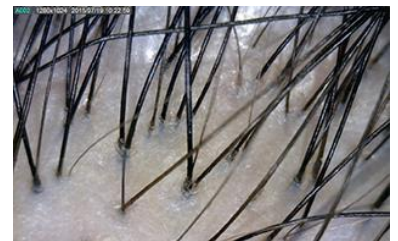
拡大された頭皮・頭髪