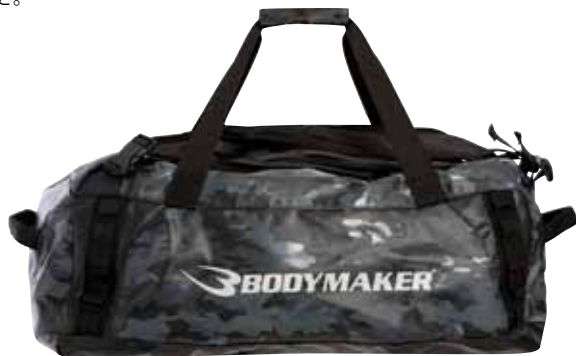
カモフラージュ×ホワイト

リュックとしても使えるショルダーがついて汎用性の高いダッフルバッグ。ターポリン生地を使用しタフな質感とカモフラージュ柄がマッチします。上蓋はファスナーで大きく開口し中身が取り出しやすい仕様になっています。蓋裏にメッシュのファスナー付きポケット、外側に1か所ファスナーポケット付き。