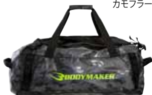
カモフラージュ×ライムグリーン