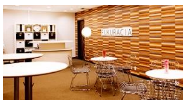
フクラシア品川（高輪）