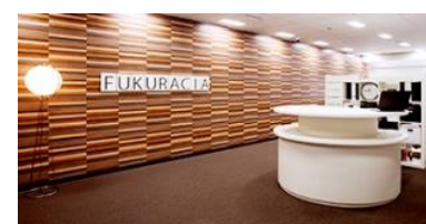
フクラシア浜松町