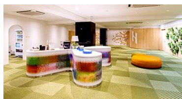
フクラシア八重洲