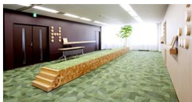
フクラシア東京ステーション