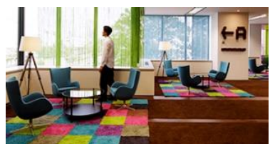
フクラシア品川クリスタルスクエア