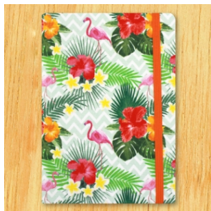
Vivi Palette Flamingo