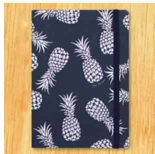
KONA BAY HAWAII Pineapple