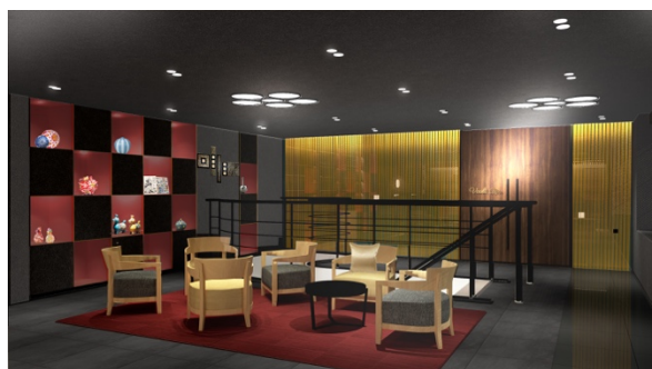
金沢らしさを素材やオブジェで演出