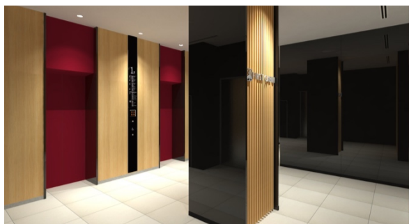
男女別エレベーターで女性も安心