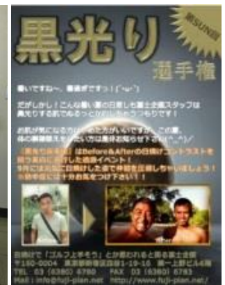
『黒光り選手権』のポスター