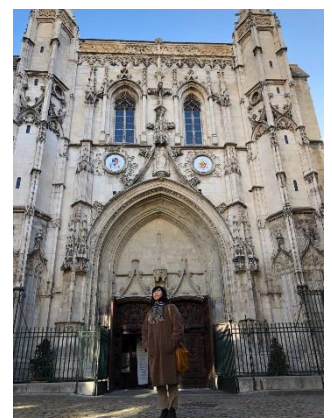
1年に4回は海外で長期旅行を楽しむ社員

社員からは「仕事とプライベートの両立ができて、毎日が充実している」「仕事に集中しやすい」「休めるように、社員同士のチームワーク力が高まった」などと好評です。