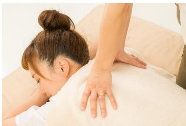
いつもの会議室で、本格的なスパトリートメントを受けることができる