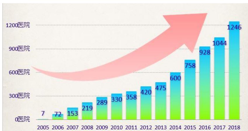
「認定歯科医療機関数の推移」

現在、46都道府県に1246の認定歯科医療機関（2018年7月31日時点）があります。インプラントでは適切なメンテナンスを受けないと、患者様によっては5年ほどでダメになってしまう例もあります。メンテナンスを受けなくなる理由として、引っ越しや転職などによってメンテナンスや治療の過程がゼロになり。また新たな歯科医院等に