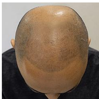
「1day 坊主タトゥー」施術後