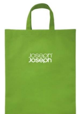
ロゴ入り特製バッグ

本商品は 8 月 22 日から Joseph Joseph オンラインストア( https://www.josephjoseph.jp/ )および専門店・量販店を中心に、全国 250 店舗で展開し、今年度 5,000 個の販売を目指します。