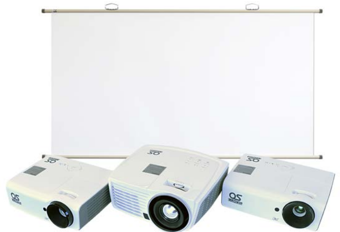
スクリーンセット（3 機種いずれかと掛図スクリーン）