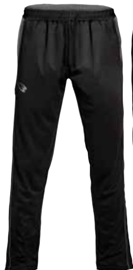
BLACK × GRAY ブラック×グレー