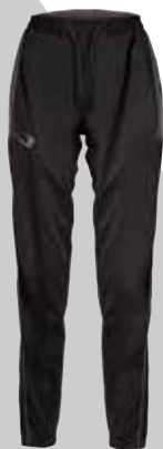
BLACK × GRAY ブラック×グレー