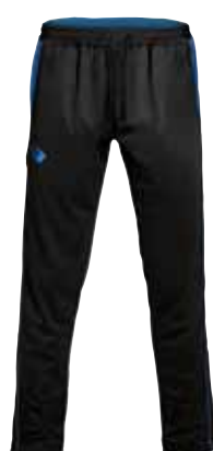
BLACK × BLUE ブラック×ブルー