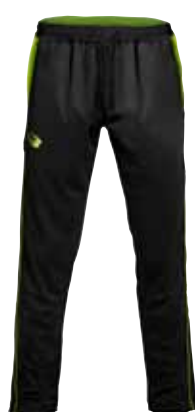
BLACK × LIME GREEN ブラック×ライムグリーン