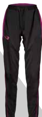
BLACK × PINK ブラック×ピンク