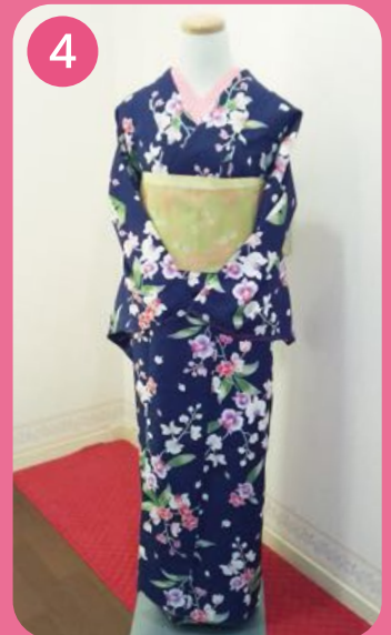
4 結い姫(ロール帯)を 着用して完成です。