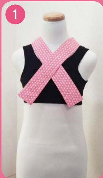
1 えり姫(えり付ブラ)を 着用します。