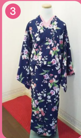
3 楽ら姫(着物ジャケット)を 着用します。