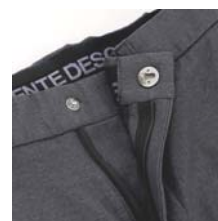
スライドスナップ前カン