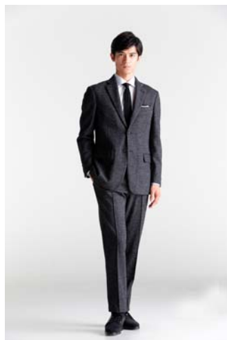
デサントスーツ 「レギュラーモデル」着用

ベーシックなデザインながら、随所にスポーツテイストを取り入れたスーツです。ジャケットの上衿を立てると襟裏リフレクター（光反射帯）が出現し、夜間自転車に乗った際の視認性を高めます。パンツにはプリーツが消えないパワークリースラインを採用し、伸縮性の高いストレッチマーベルトは快適な着用感です。生地はウールタッチなストレッチ素材で、ビジネスウェアとしての視認性と動きやすい動作性を両立します。