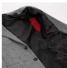
パワーネット裏地