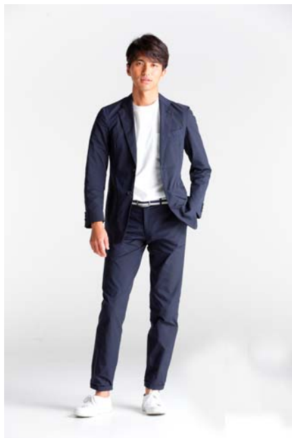
デサントスーツ着用画像