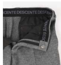
ストレッチマーベルト