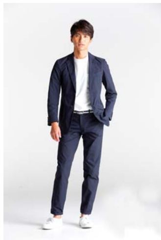
デサントスーツ 「シグネチャーモデル」着用

スポーツテイストをふんだんに取り入れたスーツです。アームホールには腕の可動域を広げるためのアクションプリーツ、脇下蛇腹プリーツ、伸縮性のあるパワーネット裏地を採用し、パンツは立体縫製デザインで動きやすく快適な着用感です。