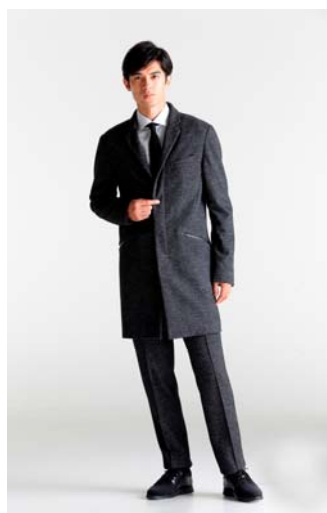
デサントコート 「スタンドカラーコート」着用