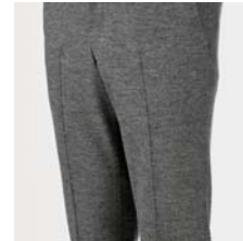
パワークリースライン