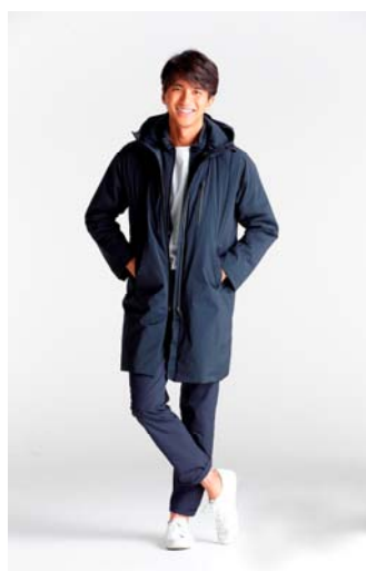
デサントコート 「フーテッドコート」着用

ライナーのベストを取り外して使える 3WAY 仕様です。中綿にはデサントの開発した機能素材「HEAT NAVI®」を採用しています。