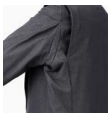
脇下蛇腹プリーツ