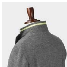
襟裏リフレクター （光反射帯）