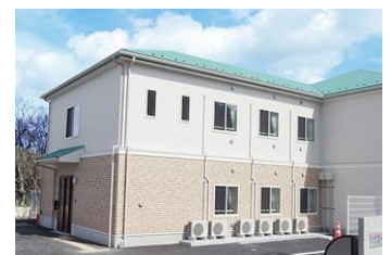
オセアンビクトリア戸塚

贈呈先 : オセアンビクトリア戸塚 住所 : 神奈川県横浜市戸塚区戸塚町 4711-1 オセアン矢沢ビル 301 入居者数 : 16 名 設立年 : 2018 年 4 月 運営元 : オセアンケアワーク株式会社