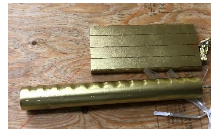
金色に塗装した手すりと補強板