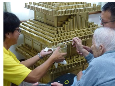
91歳の入居者による仕上げのひと塗り

天守閣の模型は、地域の方にも見られるように、地域のお祭りなどの機会にあわせて一般公開を検討しています。