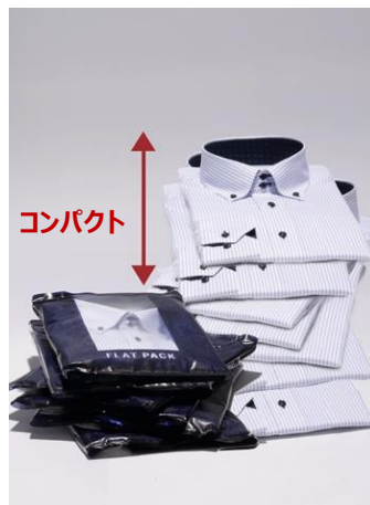
※通常のシャツと FLAT PACK の比較

東京シャツ最大の強みである、綿 100%形態安定シャツをメインアイテムに、商品クオリティー・コストパフォーマンスを重視した商品を全体で約 1500 点販売します。普段使いのシャツから、結婚式やパーティなど特別なシーンで着用するシャツなど様々なデザインを取り揃えています。今年 1 月から発売を開始した「SUPIMA(高級ピマ綿)シャツは、超長綿のふんわりとした肌触りで、心地よく着用でき、カシマのようなツヤ感や、ドレス仕立てのキレイ目な雰囲気の特徴です。 <取り扱い商品一例>