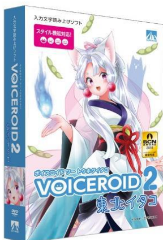
VOICEROID2 東北イタコ BOX画像

『VOICEROID2 東北イタコ』は、既に発売されている『VOICEROID+ 東北ずん子』『VOICEROID+ 東北きりたん』の姉妹となり、東北の復興を支援しようとの思いから登場したキャラクターの読み上げソフトです。『VOICEROID2 東北イタコ』の商品化は、クラウドファンディングにて1100人以上の方から2400万円近くのご支援をいただき実現しました。