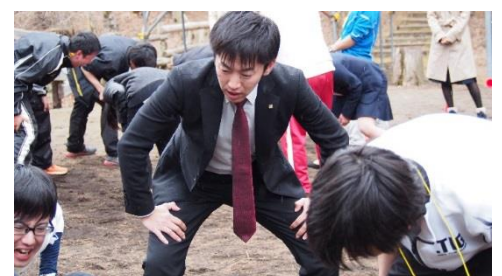
結果をだせない新入社員に先輩社員がアドバイス

また、新入社員の研修効果を高めるために“社内の風通し”を良くすることが重要と考えています。そのため、事前に幹部、中堅、若手社員の順で当研修を受けてもらいます。上司や先輩社員も研修の場を体験することで、新入社員との共通言語が生まれ、コミュニケーションの幅が広がります。また、人事担当や上司が社員の性格やスキルを客観的に捉えることができるため、会社の組織作りに貢献できます。合宿期間、先輩社員や幹部社員をはじめ、経営者達が駆けつけて新入社員の動向を注視します。研修中、チーム内のコミュニケーショントラブルに何度も直面し、弱音を吐く新入社員がいます。その時に、研修の様子を見守る企業の社長をはじめ、上司、先輩社員と本音で話し合いをおこない、新入社員が問題に向き合って乗り越える力を身につけます。