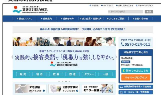
『英語対応能力検定』