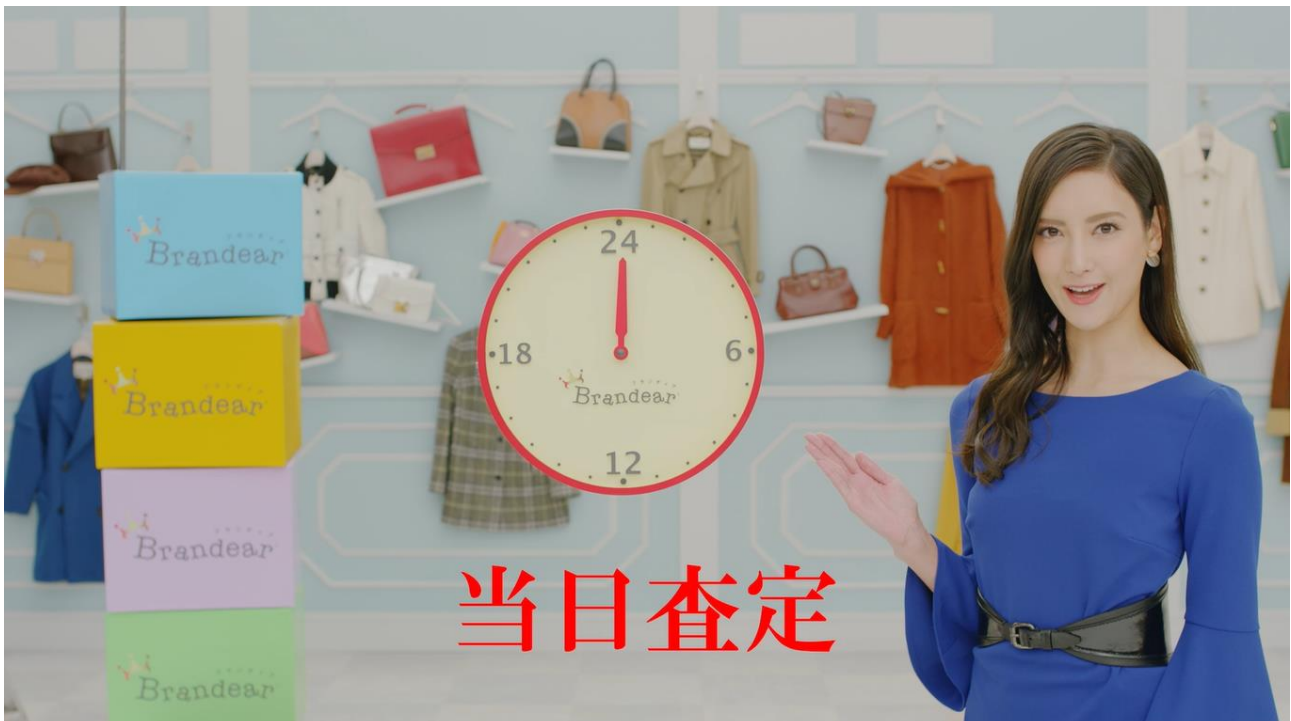
『トリセツダンス』篇 CM 画面