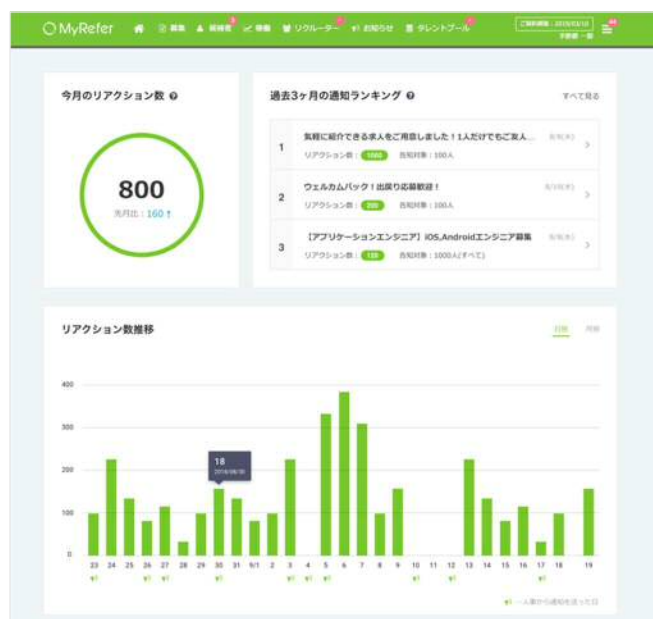
3 ダッシュボードで退職社員のリアクション数などを分析も容易に