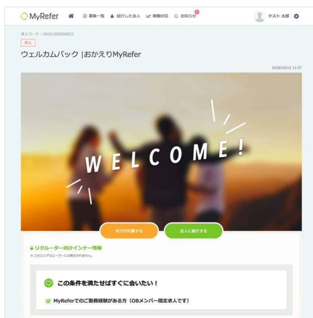
出戻り求人・イベントの作成と配信