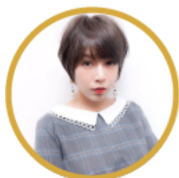
【強運少女日本日記 RU Channel】