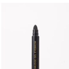
★シリコン製 スマッジチップ