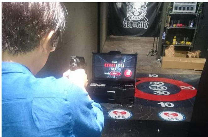
電子ターゲットの様子

小型PCをつなげたTVモニター（32インチ）に向かって直接エアガンを射撃できるものです。モニターには特殊な透明マットを使用しており、センサーが着弾点を感知します。そのため画面内の動く標的等をエアガン射撃で当てる事が出来ます。通常のエアガンは勿論、電動ガン、ガスガンなど国内規定に沿ったものであればどんな銃でも遊ぶ事が出来ます。