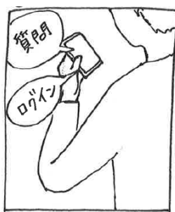
② アプリからブースにログイン します。『そうだ、あのブース に行こう』