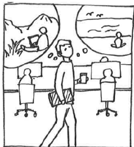
① 仕事に行き詰ったワーカーがいます。 『山の中や海辺で働いてみたいなあ』