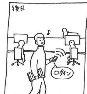
⑧ ブースを利用すればするほど、 パーソナライズされていきます。 『気持ちよく働けている気がする♪』