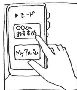
④ アプリにユーザーへのおすすめ モードなどが表示されます。