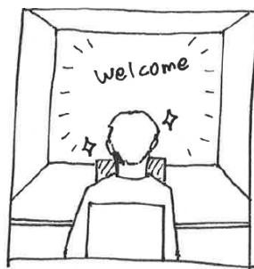
③ ブースに来たユーザーを認識 して前面が起動します。