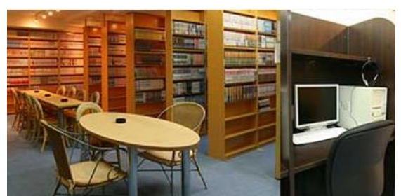
コミック&インターネットコーナー