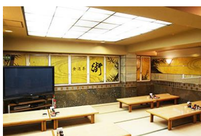
レストラン 「食酒亭・街」