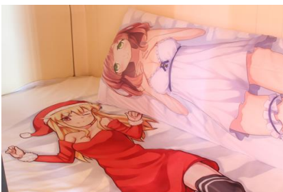
アニメコンセプトの「痛カプ」

その他の施設も充実しており、蔵書数約 25,000 冊のコミックコーナーと無料のインターネットスペースや、和洋中と幅広いメニュー構成のレストラン「食酒亭・街」で本格的な食事も召し上がることが出来ます。