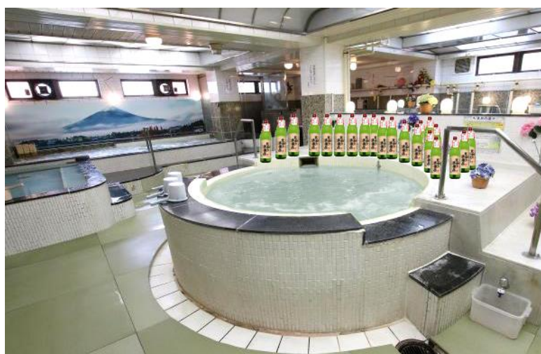
『日本酒風呂』イメージ図

当館の大浴場には季節に合わせた入浴剤を使用した渦巻風呂があります。11 月は岩下の新生姜とのコラボレーションで「岩下の新生姜風呂」を行っておりますが、11 月 26 日だけは「いい風呂の日」ということで当日限定の『日本酒風呂』をお客様にお楽しみいただきたいと考えております。