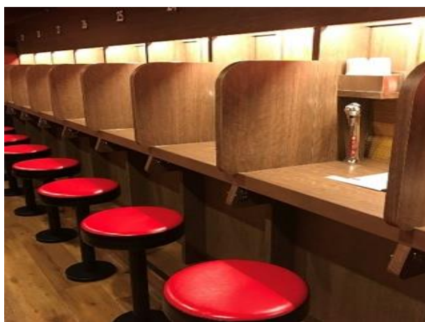
味集中カウンター(※イメージ)