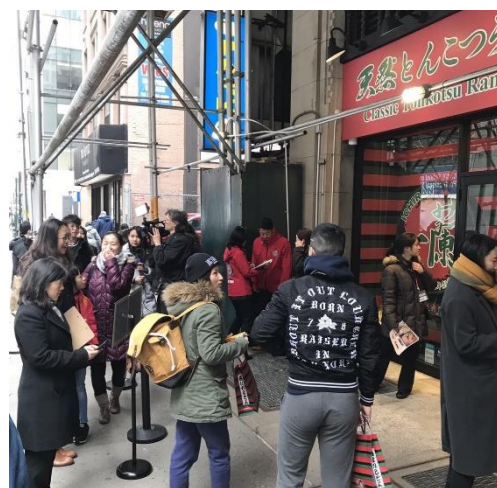
NY ミッドタウンウエスト店オープン時の様子